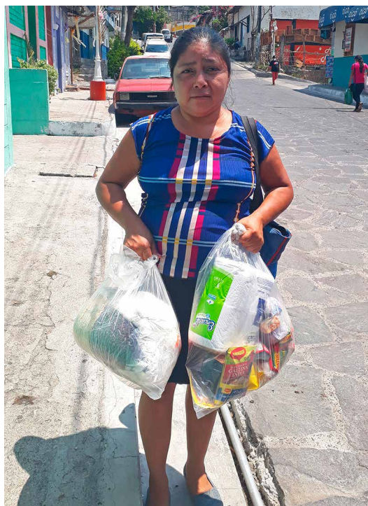
Eine Projektteilnehmerin in El Salvador erhält ein Nothilfepaket mit Lebensmitteln und Hygieneartikeln.

Wie in der Schweiz mussten Schulen und Berufsbildungszentren in Lateinamerika schliessen. Die Voraussetzungen für Fernunterricht waren denkbar schlecht: Die Teilnehmenden der Projekte von Brücke • Le pont kommen aus armen Haushalten und haben keinen oder ungenügenden Internetzugang. Das Hilfswerk unterstützte seine Partnerorganisationen dabei, die Kurse auf Fernunterricht umzustellen und den Jugendlichen Zugang