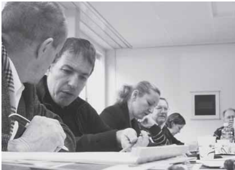
Der Vorstand von Travail.Suisse bei der Arbeit