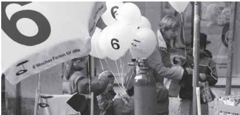
Sie machen die Passanten auf die Unterschriftensammlung aufmerksam: Ballone und Sonnenschirme

Feuilles et cartes de signatures, argumentaires ... : impressions à l'occasion d'une action de récolte de signatures