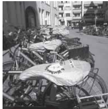
Mit Velosattelüberzügen ...