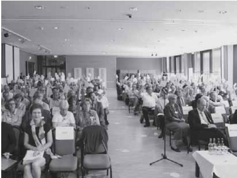
Aufmerksame Teilnehmerinnen und Teilnehmer am Kongress von Travail.Suisse

Des participants et participantes attentifs au congrès de Travail.Suisse