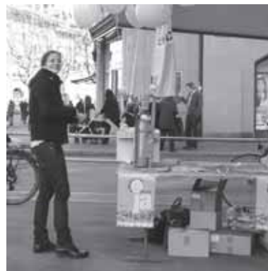
... und Standaktionen auf Stimmenfang