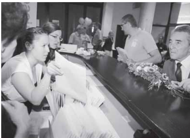
Mandatskontrolle vor Beginn der Veranstaltung