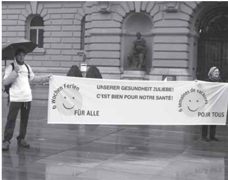
Aktion zugunsten der Initiative «6 Wochen Ferien für alle» vor dem Bundeshaus

Action en faveur de l'initiative « 6 semaines de vacances » devant le Palais fédéral