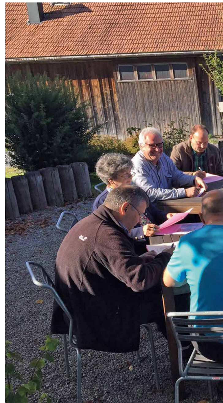
Weiter mit Bildung: Mitglieder von Travail.Suisse-Verbänden an einem Weiterbildungskurs von ARC.

d'une 2 ème langue nationale et de l'anglais, entravent inutilement la mobilité et affectent négativement les enfants et les jeunes. C'est pourquoi, Travail.Suisse soutient le Conseil fédéral pour améliorer l'harmonisation de l'enseignement des langues.