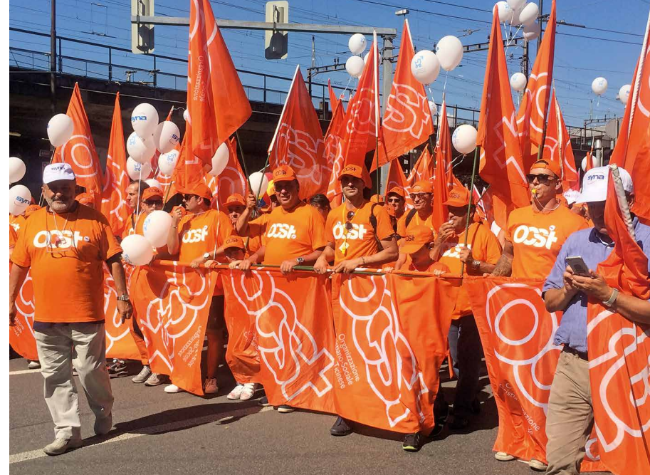
20 000 Teilnehmerinnen und Teilnehmer haben am 9. September 2016 gegen Abbaumassnahmen bei der Altersvorsorge demonstriert, darunter auch eine grosse Delegation der OCST.

Travail.Suisse hat sich im Rahmen der Vernehmlassungen zur Weiterentwicklung der Invalidenversi-